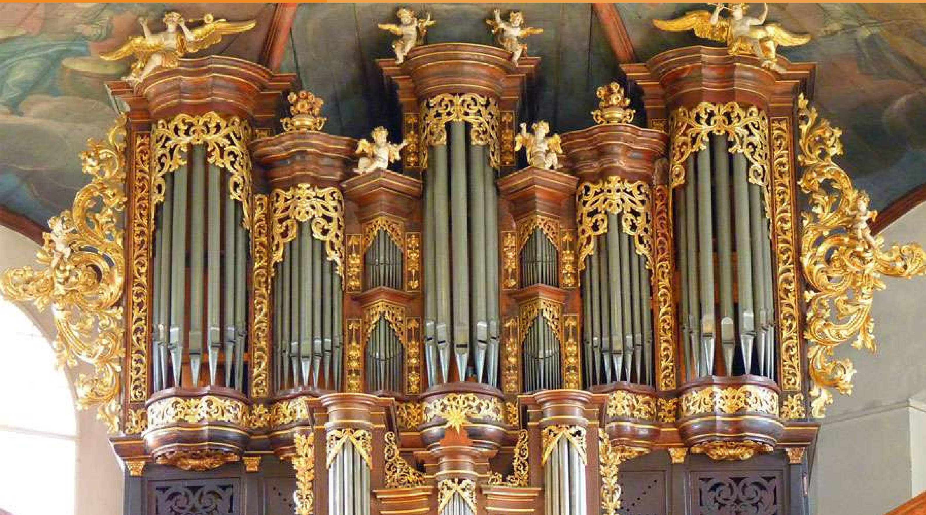
IMAGEN REFERENCIAL

DIRIGIDO A TODOS LOS MIEMBROS DEL PUEBLO DE DIOS QUE SE SIENTAN LLAMADOS A PROFUNDIZAR EN LITURGIA, BIBLIA Y ARTE MUSICAL: ESTUDIANTES, MINISTERIOS MUSICALES Y MÚSICOS